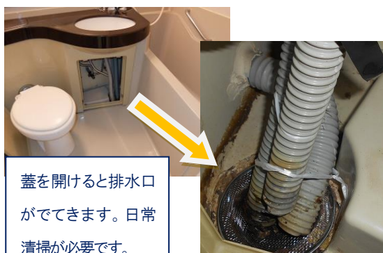
蓋を開けると排水口がでできます。日常清掃が必要です。

排水口が露出されずにカバーで隠れている造りの場合、入居者様も日常清掃できる範囲と認識していないこともあり、入居後一度も清掃したことがないと言われる事が多々ございます。