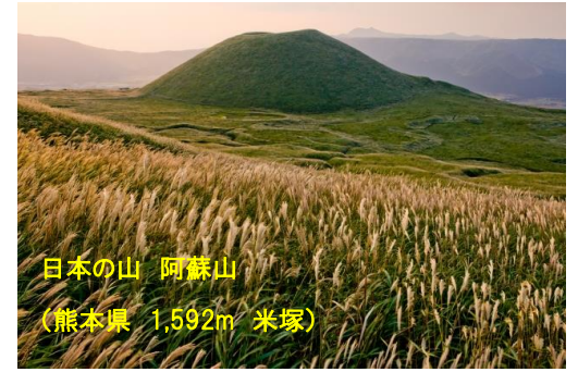
日本の山 阿蘇山 (熊本県 1,592m 米塚)